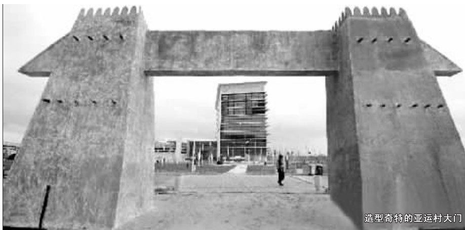
造型奇特的亚运村大门

阿特金斯还透露:“开幕式中的服装将近一万种,其中有中国京剧的服装,也有100多名从广州来的中国艺术家参加表演。我们讲述故事的同时,把卡塔尔的海洋和沙漠体现出来,把卡塔尔和亚洲的贸易体现出来,当然,我们主要体现和平的概念。”