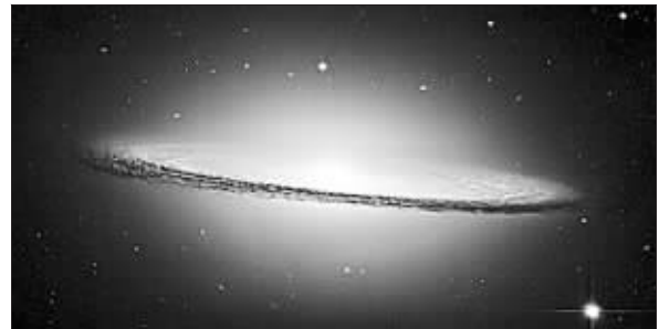
太空第一美景:宽边帽星系

哈勃发回来的这些精美照片展示了太空的神秘魅力,难以用语言准确表达出来。摘得冠军头衔的宽边帽星系照片最令人惊叹,这个外形极像一顶阔边帽的星系,距地球2800万光年,自身横跨5万光年的距离,拥有8000亿颗恒星。