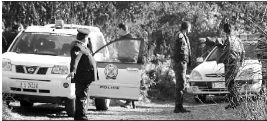
25日,希腊警方对5名猎人遭枪杀一案展开调查和搜捕行动

一个希腊家庭中的5名成员一起去打猎时,没想到自己反而成了“猎物”,被神秘狙击手一个接一个地猎杀。凶手先是远距离开枪将他们一一击倒,然后又近距离补上至少一枪,确保他们身亡。希腊警方目前正在对这起枪杀案展开调查。