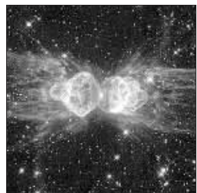
第二美景:蚂蚁星云