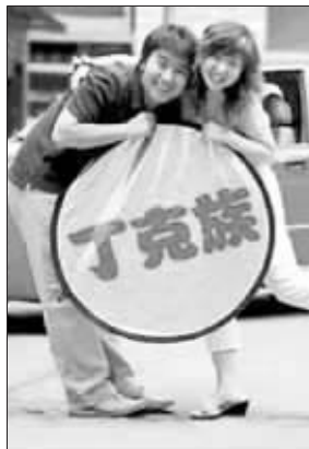
“丁克”也快乐(资料图片)