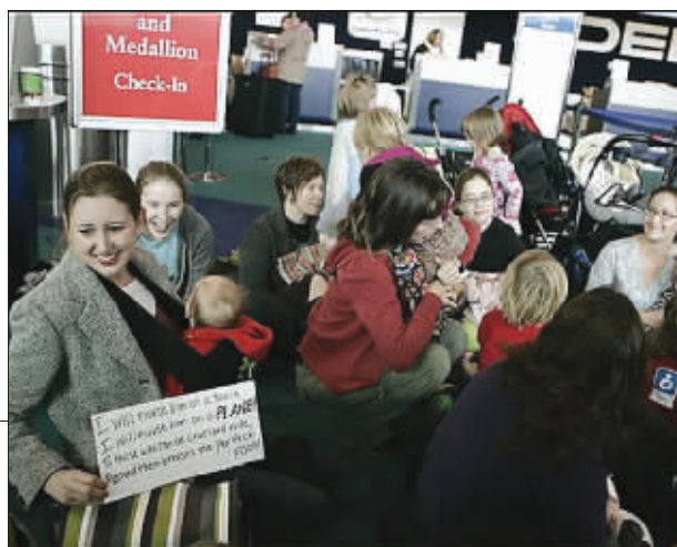
►40名母亲齐聚俄勒冈州波特兰机场给孩子喂奶。她们是全美各地机场“哺乳抗议”者中的一部分。

美国妇女埃米莉·吉勒特10月因在乘坐飞机时哺乳孩子而被赶下飞机。这一遭遇引发“感同身受”的众多母亲的同情。美国30多个机场21日分别遭遇“哺乳抗议”。每座机场的候机大厅内都聚集了数十名母亲,集体哺乳孩子,以示对吉勒特支持。