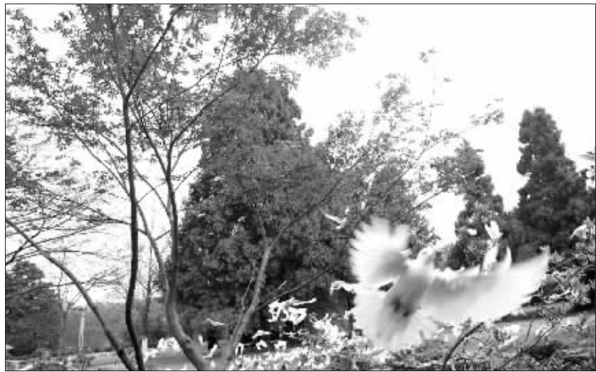
近日,连绵秋雨让彩叶树全都变了色,南京进入一年中色彩最缤纷的时期