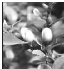
来迟了,赶早了,全都凑到一块开花了。海棠(左1)、腊梅(左2)、樱花(左3)、含笑(右)