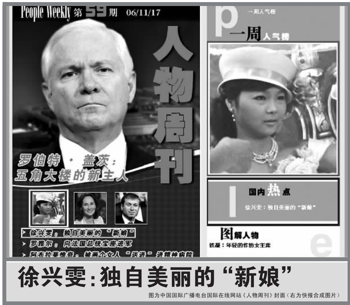
图为中国国际广播电台国际在线网站《人物周刊》封面(右为快报合成图片)

众多网络媒体，也纷纷转载了这则新闻。记者以“徐兴雯”为关键词，在百度上搜出4100条相关新闻。媒体的关注，就像一个个接力棒，将爱心一直传递下去，而且感染越来越多的人加入到关心、帮助兴雯的行列中来。正如白岩松在节目中所说——帮助别人，也是一种幸福！