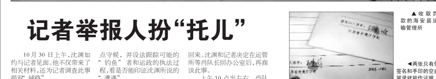
▲收取罚款的海安县运输管理所 ▲两张只有假签名和手印的空白笔录作证据