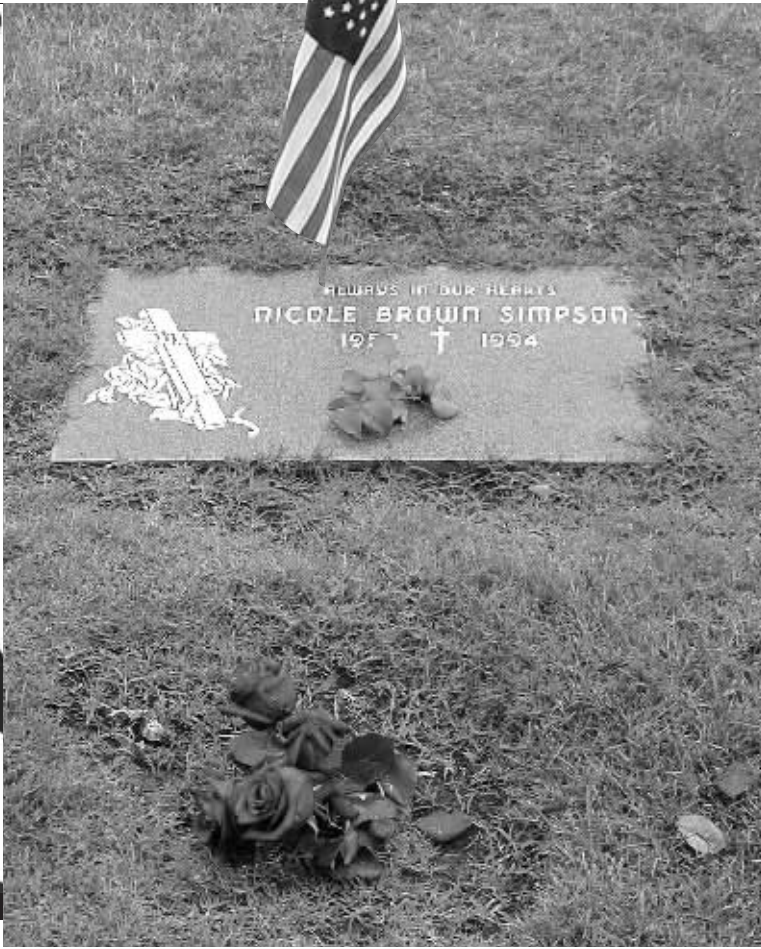
辛普森前妻的墓地