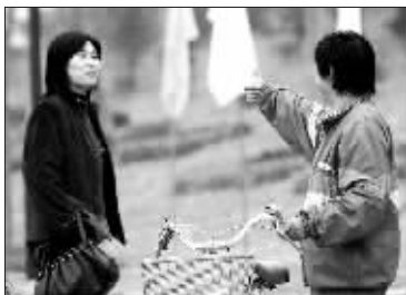
体院的工作人员向栾菊杰(左)竖起了大拇指

深秋的南京，已经有了一丝寒意。在南体校史陈列馆开馆之际，国家体育总局前局长袁伟民、奥运冠军栾菊杰、林莉、葛菲等回到了母校。