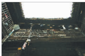
老民居的雕花栏杆