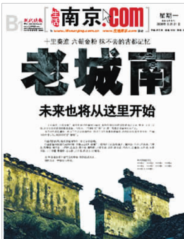
快报8月21日推出“老城南”特刊,引发各方强烈关注

有着2500年建城史的南京古城,其命运走向总是牵动人心。2006年的这个夏天,老城南的拆迁让这座城市的市民深感惋惜,快报推出的《老城南》特刊唤起了更多的人去关注城市发展、关注历史与未来的和谐。 让人欣慰的是,南京市政府为完善历史文化的保护,要求多部门着手调研。昨天,一份涵盖了十类33条建议的规划请示已经递交到了政府,一些举措甚至是对现有政策的匡正。