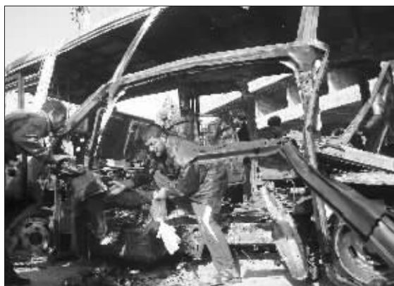
人们在巴格达的爆炸现场查看车辆残骸

呼声,共和党参议员麦凯恩在NBC的“面对媒体”节目中提出针锋相对的观点。他说,“当前形势不可预测”,美国在伊拉克的任何撤军行动都会给整个中东地区造成混乱。