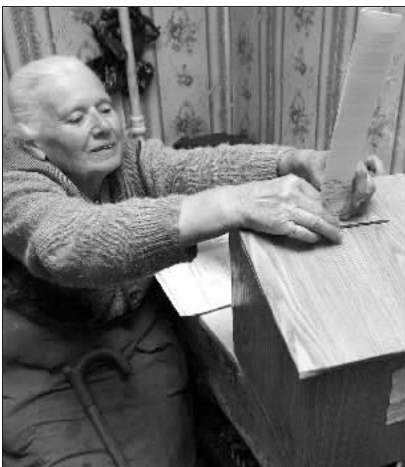
一个老妇人郑重地投出自己的一票