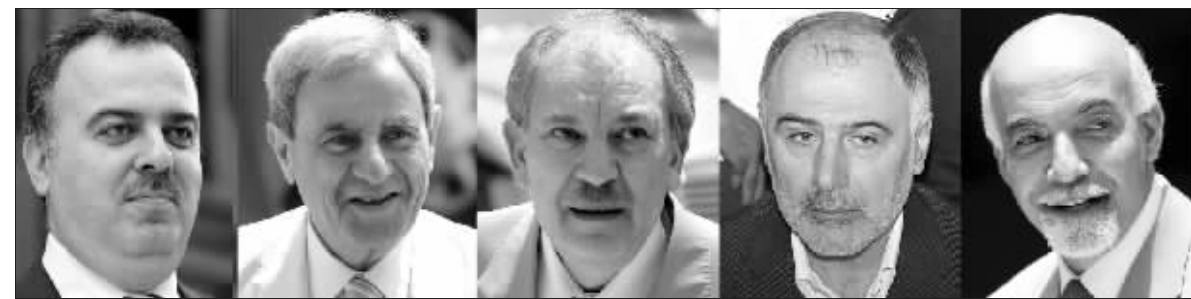
图为辞职的什叶派五部长

在谈判组建联合政府过程中,真主党和“阿迈勒”运动以及另一些政治盟友要求它们的代表在联合政府中的比例至少达到三分之一,这