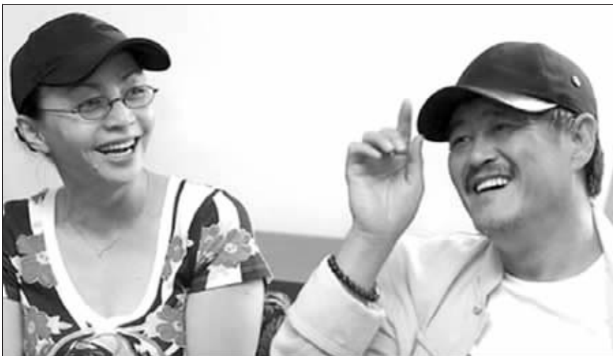
赵本山和宋丹丹珠联璧合

赵本山的喜剧表演艺术,已经达到了出神入化的境界。如果把春晚比作年夜饭,那么赵本山无疑是年夜饭上那道压轴的主菜。最近,春晚总导演金越以赵本山老朋友的身份先给观众一剂定心丸,透露这位笑星已经在为2007年的春晚节目“一晚上、一晚上睡不着觉”了。那么,今年赵本山将如何上春晚呢?