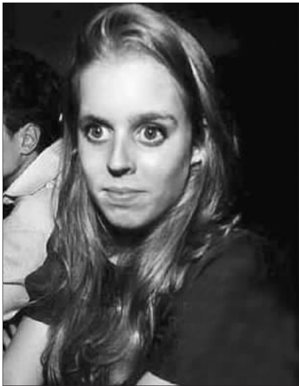
英国公主比阿特丽斯

作为新兴旅游项目,太空游吸引了不少人的目光。英国公主比阿特丽斯便是其中一位。在男友克拉克的鼓励下,比阿特丽斯将乘坐维珍银河公司的飞船进行太空旅行,由此成为英国王室遨游太空第一人。