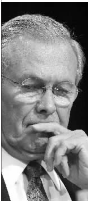
拉姆斯菲尔德不知道在想什么