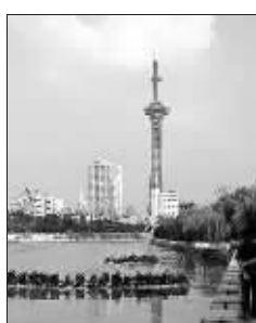
南京外秦淮河已由臭水河变成风光带

江苏是文化大省,同时也是“教育大省”。据统计,2005年,全省普通高等学校共115所,专任教师数量为7.49万人,在校大学生共计115.98万人,分别比上年增长2.6%、13.3%和16.6%。从全国来看,2004年,无论是普通高等学校数量、专任教师数量还是在大学生数量均列全国第一位,分别占全国的6.4%、6.9%和7.5%。