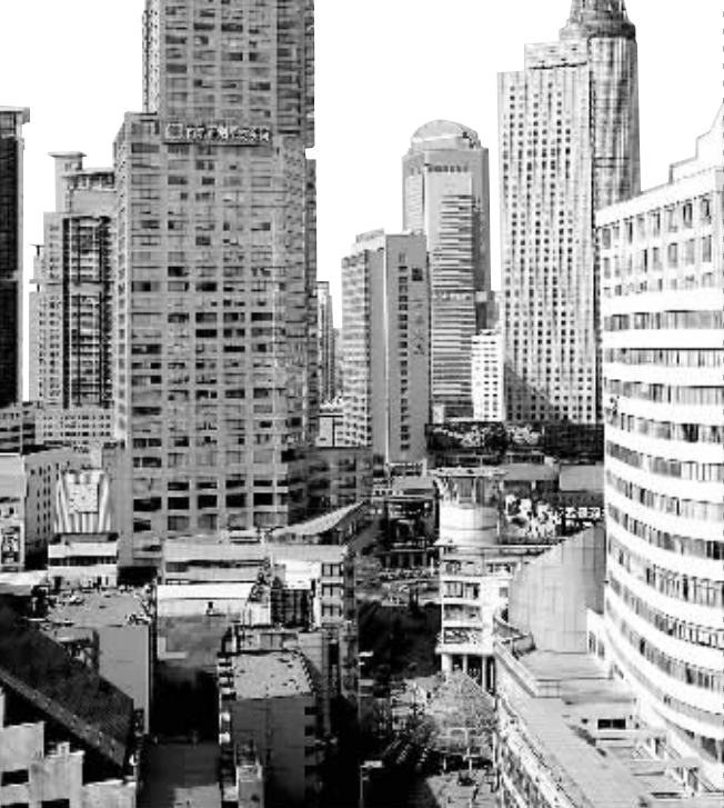
如今南京超过100米的超高层建筑已达124栋 (资料图片)

国家统计局宣布了2006年百强县前十位名单,其中江苏有7个县级市入选。据了解,十强县人均GDP达到6.6万元。以人均GDP衡量,十强县的经济水平已超过京津沪及江浙粤等县级以上城市的平均水平。