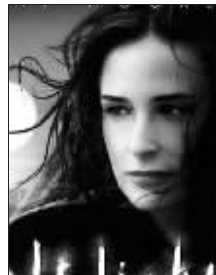
黛米·摩尔新片海报

今年已经45岁“高龄”的女星黛米·摩尔,当年凭借一部《人鬼情未了》成为在中国家喻户晓的好莱坞女星。然而近十年来她的星途坎坷,主演的影片连连遭