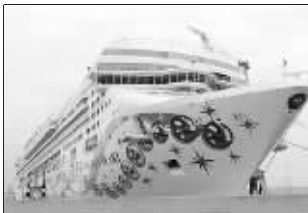
“挪威珍珠”号客轮驶离德国

法国电力传输公司解释说,由于欧洲电网德国部分段电力供应出现问题,导致整个欧洲电网电力供应严重失衡,为避免电网全面崩溃,该公司不得不紧急切断了500万人的电力供应。估计全欧洲共有1000多万人受到影响。新华