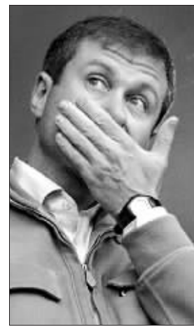
阿布具有双重性格

至于阿布不惜重金购买、发展切尔西足球俱乐部一事,哈钦斯不相信这单单是出于对足球的狂热喜爱。他认为,阿布此举的一个理