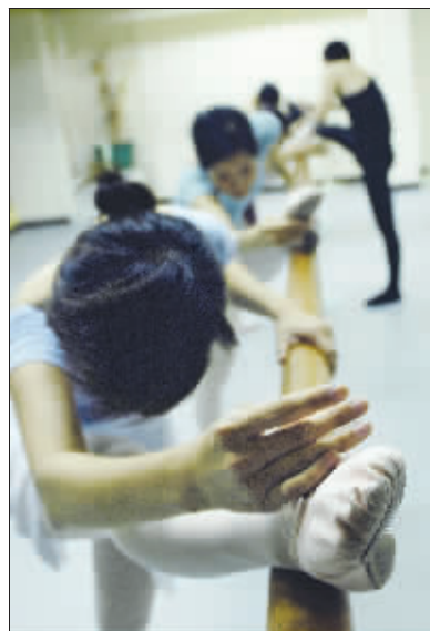
每一个动作都一丝不苟