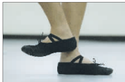
基本的脚位看似简单,却是整个芭蕾舞的根基。虽然是男人的脚,但练起来也是有模有样。