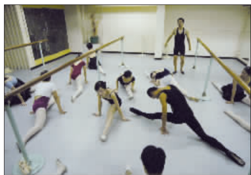
男人学芭蕾还是需要勇气的,有位男孩就因为要学芭蕾,他女朋友差点跟他分手。