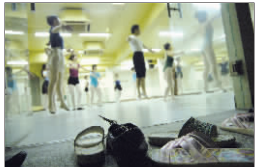
挑灯夜战+挥汗如雨,这就是这些学员的芭蕾生活。