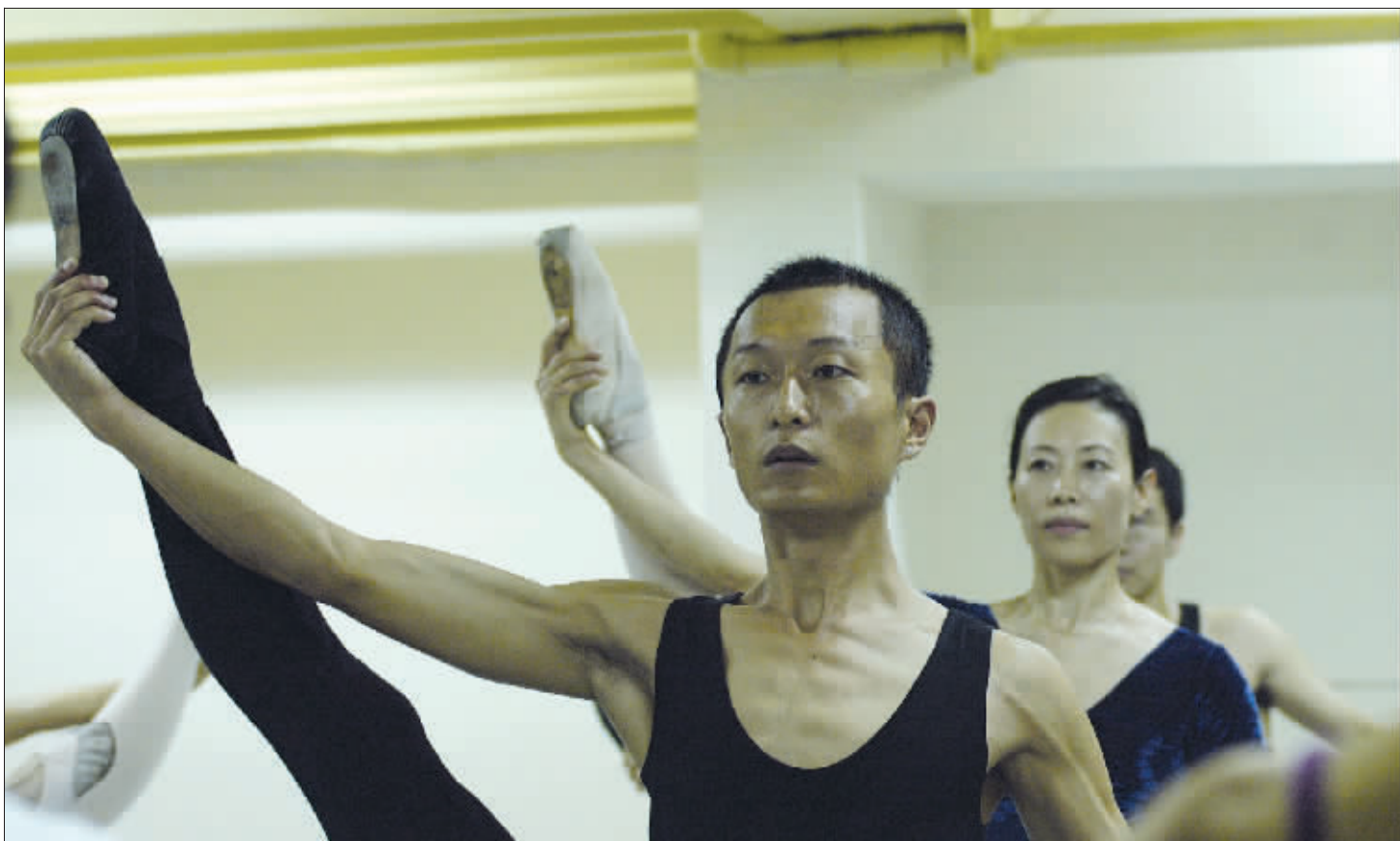
芭蕾舞的练习实际上是个苦差使,对没有舞蹈基础的学员们来说,则更加困难。但学员们在老师的带领下依然练得有声有色。