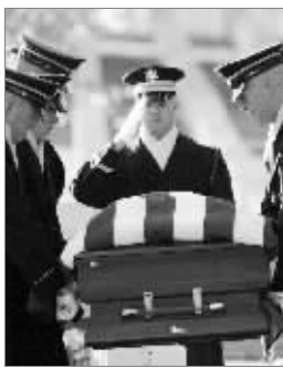
又一在伊拉克阵亡的美国士兵的遗体准备安葬