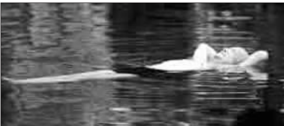
陈桥会老人在平静的水中漂浮了一个多小时