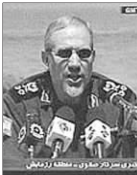
伊朗电视台报道军演