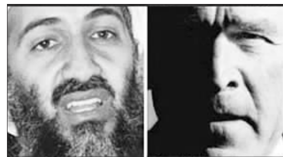
布什(右)和拉丹双双上榜

民调结果显示,在英国,69%受调查者认为,2001年以来美国政策让世界更加不安全,只有7%的人肯