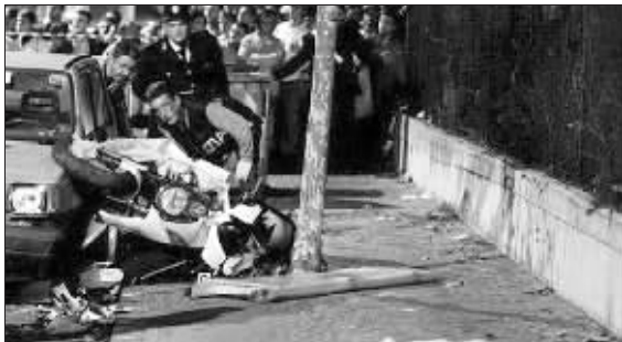
那不勒斯凶杀事件现场

由于那不勒斯近期凶杀事件频发,而这与意大利新政府就职后不久议会匆忙通过的大赦令有联系,意中左联盟政府正因日渐恶化的治安问题而备受民众的批评。