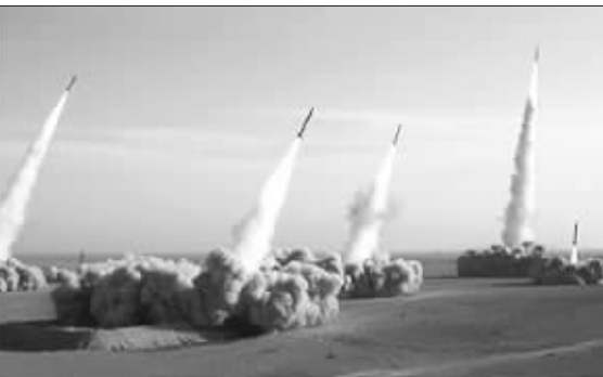
伊朗在军事演习中试射导弹

当地时间11月2日,伊朗在海湾地区开始为期10天的海陆空联合军事演习,发射了数枚导弹,并展示一系列国产、进口武器,让原本紧张的局势再度升级。目前四艘美国航母已相继驶往海湾水域,而伊朗也以更加强硬的态度应对国际制裁呼声。