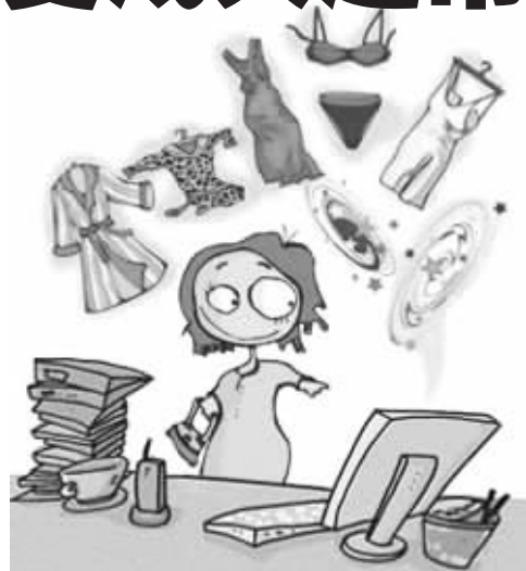
鼠标一点,东西全来 资料图片

以前要想让出国的人帮着从国外带点东西,就算沾亲带故的人都会觉得麻烦。现在你心安理得地把这些事都交给专业人员来做吧。电子商务培养出一大批“跑腿儿买办”,你只需要说出商品的名字,不管是名牌护肤品、Gucci皮带还是日本高级玩具,动动鼠标,几天之后,送货上门。你需要做的就是给送货员付点跑腿费。