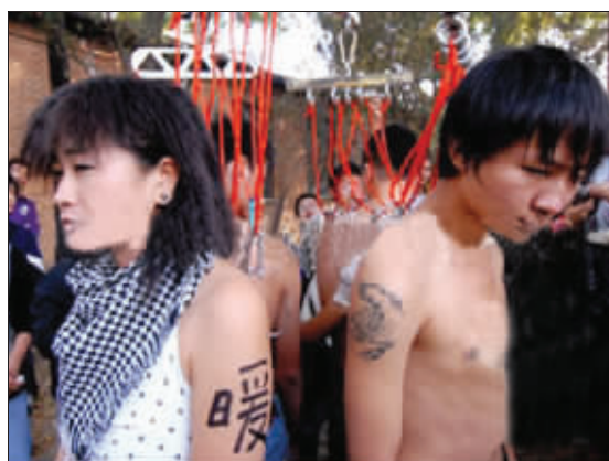
北京798工厂4人人体悬挂现场

组合钢管、系绳子、维持铁链的平衡,这都是悬挂之前的准备工作。过程进展很缓慢,过了一个小时,悬挂用具才安好。