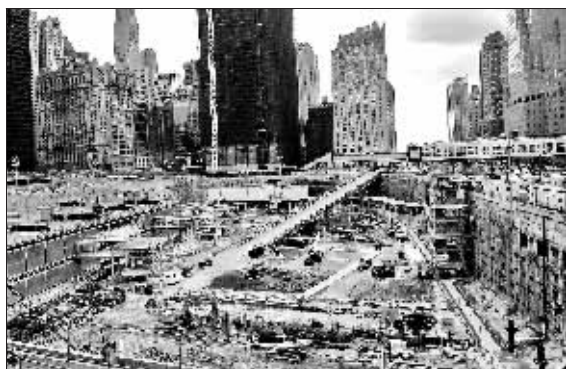
美国纽约世贸中心遗址现场

5年前“9·11”恐怖袭击中,世贸中心的一段楼梯挽救了许多人的生命。而今,作为见证“9·11”事件现场的最后遗迹,这段楼梯很可能要和人们挥手作别。