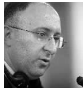
格外长格拉·别茹阿什维利

一场间谍风波引发的俄格关系紧张持续两月有余,随着格鲁吉亚外交部长格拉·别茹阿什维利10月31日飞往莫斯科参加对话,这场危机的解决终见一丝曙光。