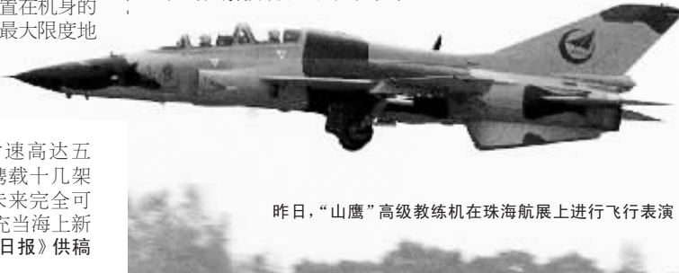
昨日,“山鹰”高级教练机在珠海航展上进行飞行表演