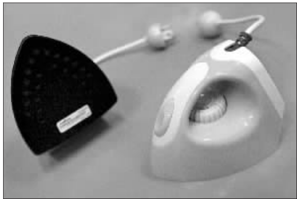
看似熨斗,其实是小音箱

□快报讯(记者 钟晓敏)好玩又有个性的小店在南京是越来越多,昨天记者就在新街口发现了一个名叫“创意生活”的小店,里面每件物品都极富个性。