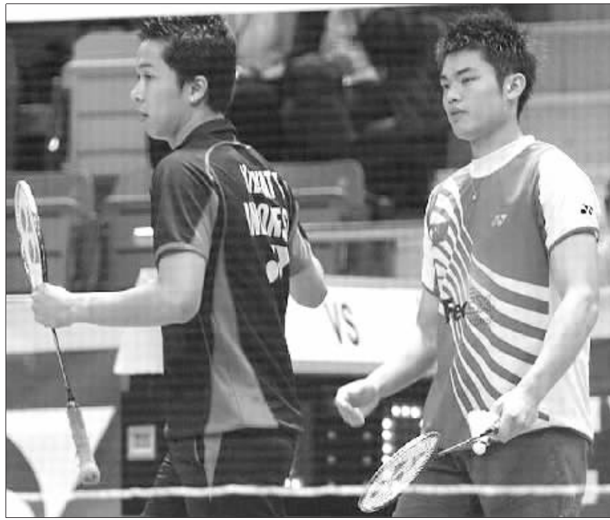
陶菲克弃权已不是头一回了