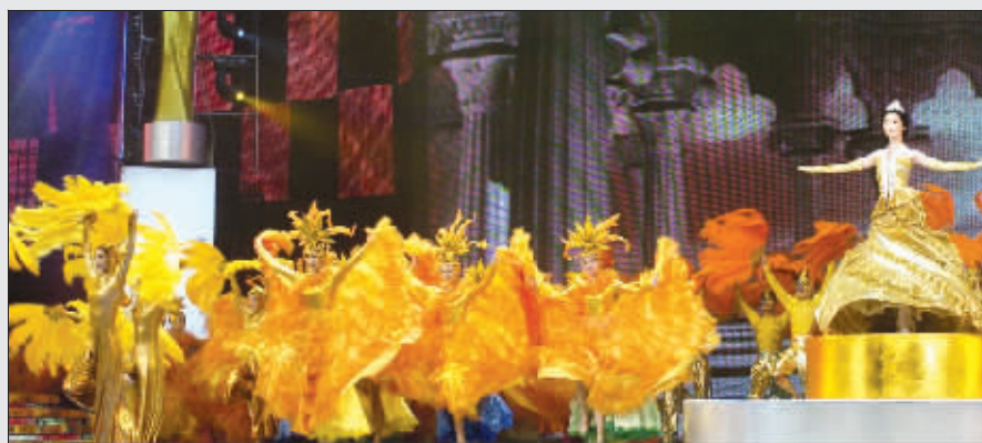
刘亦菲扮演“金鹰女神”出尽风头

经过两年的休整,金鹰电视节昨晚盛大开幕。与金鸡百花的星光黯淡相比,6岁的金鹰在明星的护航中展翅高飞。“女神”刘亦菲的惊艳登场,老牌歌星韦唯、刘欢的助阵,新老超女的同台PK,香港TVB明星林保怡、黎姿的倾情献唱,“容嬷嬷”李明启带着“九凤”欢喜过生日……金鹰节成了全国电视人齐聚一堂的嘉年华。记者在现场亲身体验到开幕式的几大亮点,按照电视节的颁奖方式,评出了几个“最”。