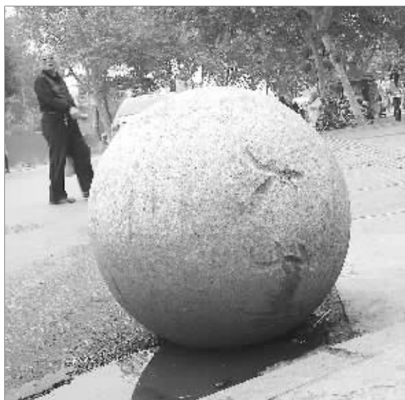
刻着“夫子庙”三字的石球挪了窝