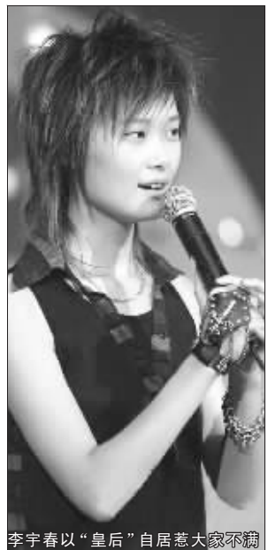
李宇春以“皇后”自居惹大家不满

最近,“天涯”论坛的网友们通过集中投票,统计出票数最多的男、女各前三位名人,当选年度最恶心艺人。金乌鸦奖已经连续举办过两届,胡兵、李宇春、林志玲等众多大腕曾出现在榜单上。前不久,第三届金乌鸦奖开幕了,网友投票异常踊跃。