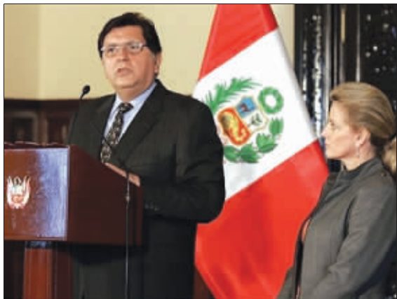
加西亚总统和夫人皮拉·诺里斯