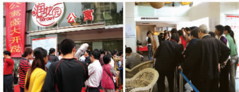
●2006年10月21日开盘现场盛况

10月21日,润花园·喜跃07幢精装挑高小公馆在众人翘首热盼中盛大开盘。当日,蜂拥而至的看房者将其售楼处外围得水泄不通,买手甚至出现了多位客户同时看中并争抢一套公寓的罕见。其前一开盘即热销的场景,与不久前08幢开盘场面相比势头有增无减。据了解,喜跃08幢挑高户型开盘不到半天便告售罄,可以预见,这次新开盘的07幢必将畅销如虹。