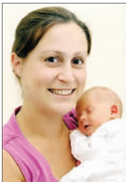
分娩直播的霍斯里和宝宝

不久前,英国一场电视真人秀让观众目瞪口呆:屏幕上出现的是一位孕妇实施剖腹产的全过程。节目播出后,引来一片争议之声,制作公司差点陷入法律纠纷。节目中的孕妇日前主动出面,通过英国《每日邮报》向公众澄清事实,讲述缘何面对镜头分娩的前因后果。