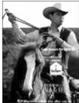
万宝路香烟广告酷男形象

是真人真事,虚构形象对于我们的生活同样重要,有时甚至比现实事物影响力还要大。”拉扎尔说。刘铮箏