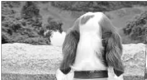
小狗狗相继在这里跳桥“自杀”

英国苏格兰丹巴顿附近米尔顿地区的奥弗顿大桥,是英国家喻户晓的“狗类自杀桥”,在过去半个世纪中,至少50只狗从桥上跳下,摔死在15米深的岩石河谷中。仅在去年上半年,跳桥“自杀”的狗就有5只。狗类“自杀”之谜一直困扰着英国科学家,直到最近,科学家终于解开了“狗类自杀桥”之谜,原来是河谷下水貂的臭味吸引了狗,导致它们跳桥追踪,结果却坠桥身亡。