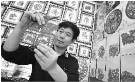
金陵神剪张

南京工艺有三宝,云锦剪纸仿古雕。其中的剪纸,南北风格兼容、粗中有细。尤其取材多种颜色纸张的“斗香花”剪纸法,造型色彩变幻无穷,全国独一无二,海内外名气很大,但眼下掌握这门技艺的老艺人已寥寥无几。