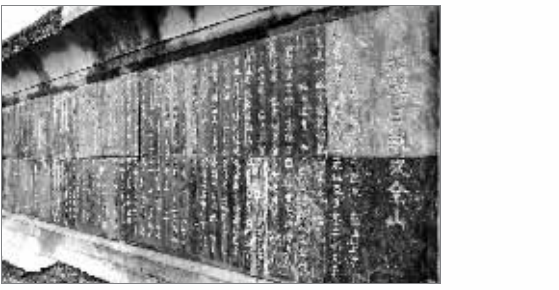
夹金山上的红军长征纪念碑。

10月4日傍晚,记者从泸定向主峰海拔4950米的夹金山进发。深夜12点,到达磅礴藏族乡。 途经几个乡村,但都已无人居住,被拆成一片废墟。路边偶尔看到工地和停着的大卡车。凌晨一点,车子陷在一处泥巴上再也动不了。抬头仰望,竟看到一座细长高大的建筑矗立在附近的一个山包上,在夜空里尤其显眼。我想,这应该就是我们寻找的纪念碑了。 次日早晨,问了工地工人才知道,明年这里将要矗立起一座拦河大坝,建起“青衣江电站”,包括那座“红军长征翻越夹金山”纪念碑在内的藏乡晓喷都要被淹没。不过,新建的纪念碑已经坐落在晓喷金堂河对面柳落山包上了。 沿着阶梯上到山上,“红军长征翻越夹金山纪念碑”的金色碑文迎面而来。纪念碑下,一个来自延安的工人正在辨读着基座上的铭文:“我们延安,有个宝登山,毛主席从这儿走过,到了我们那组。”这位工人笑着说:“夹金山被当地称作‘魔山’,当地歌谣唱:‘要想越过夹金山,除非神仙到人间。’”仅红一方面军翻越这座雪山时,就有约400名红军勇士长眠在这里。 群峰巍峨翠岚缭绕,雪水奔流汹涌澎湃。英雄长眠此处,伟大的长征不朽。