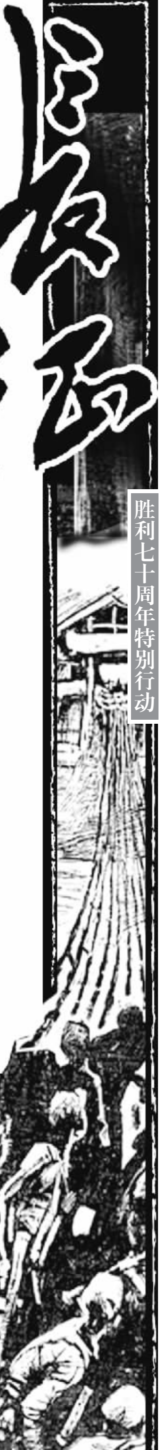
胜利七十周年特别行动