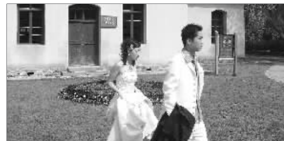
新人在枣园前拍婚纱照照

在枣园采访时, 记者不能不感叹这里就是“陕北的江南”: 绿树成荫, 碧草延伸, 清亮的幸福渠缓缓流过, 如果不是零星分布的陕北窑洞, 很容易让人以为这是一处江南园林。最吸引记者目光的, 是一对紧接一对盛装的新人, 新郎身着笔挺的西装, 新娘身穿洁白的婚纱, 他们在摄影师的“导演”下, 在绿茵上、草坪上变换着不同的“pose”……伴着不停的“咔嚓”声, 一幅幅极具现代感的画面与传统的黄土窑洞奇妙地结合在一起, 让记者产生了跨越时空般的错觉。