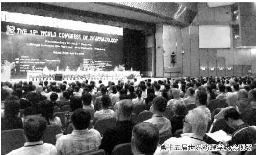
第十五届世界药理学大会现场