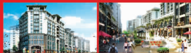
百万大效果实景图