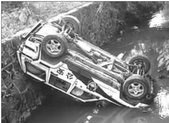
一辆警车被掀翻到水沟里

围攻事件造成中和派出所办公大厅损坏严重,几个办公室的大门被踹开,室内的办公桌、空调被毁坏,窗户玻璃多处被砸碎。所里大院内有几辆摩托车被砸倒在地,在中和镇医院附近,一辆警车被掀翻到水沟里,另一辆警车则在路边被一些群众翻倒。该镇新市场里的一户人家的家具被人扔出窗外,户内墙壁上用黑炭写上“杀人偿命”字样。