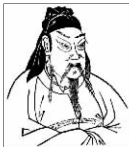
关公肖像(资料图片)

9月26日,山西运城解州关帝庙举行了第十七届关公文化节“全球华人共祭关公 四海之内同谱春秋”祭祀活动。