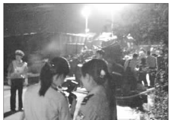
事发后,110、120迅速赶到现场营救

□快报讯 (见习记者 王觅)昨天下午5点半左右,南京市江宁区双龙大道百家湖休闲广场十字路口处,一辆牌照为苏GG019挂的加长拖挂货车在急刹车时,固定货物的麻绳断裂,拉载的一根钢结构建材飞出斗砸在驾驶室上,造成驾驶室内3人中2人死亡,一人受伤。