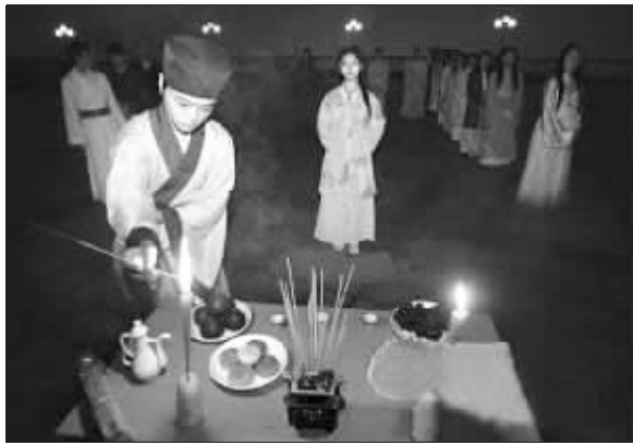
40余名身着传统汉服的汉友参加中秋节祭月活动

□据《重庆时报》报道“时维丙戌年仲秋,诚炎黄儿女,兴华名,复礼从德,祈告夜明……”5日晚7时20分许,重庆40余名汉友相聚沙坪坝区平顶山山顶,以传统“祭月”仪式祭拜月神,共同纪念中秋佳节的到来。这40余汉友中年龄最小的仅5岁,是随父母从大足赶来重庆参加祭月活动的。