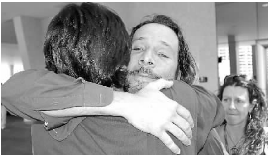
失事客机的乘客家属在首都巴西利亚以拥抱的方式互相安慰

“总统卢拉怀着巨大悲痛得知，昨天下午从玛瑙斯飞往巴西利亚的航班发生空难，夺走了乘客和机组成员的生命，”巴西总统发言人9月30日发表声明说，同时宣布此后3天为巴西哀悼日。至此，这架承载155名乘客和机组人员的巴西戈尔航空公司1907号航班失踪之谜以悲剧收场。