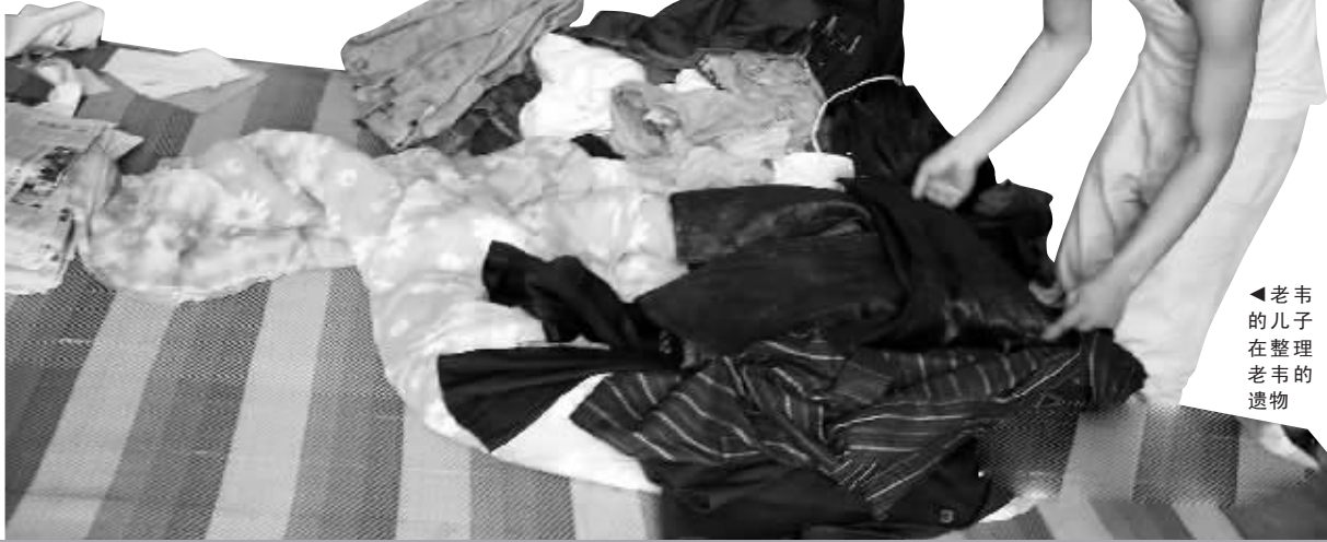
老韦的儿子在整理老韦的遗物