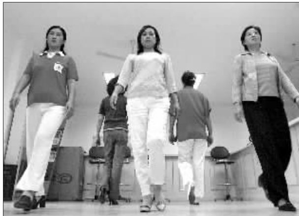
大家都相信,世上没有丑女人,只有懒女人

如果你问,树德里社区最靓丽的风景是什么?一定会有居民告诉你:“是一群‘女人花’!”她们年龄差异大职业也不同,有年轻少妇,也有古稀老奶奶,有下岗职工,也有年轻白领。不过,她们都有一个共同点,喜欢走猫步。这一走,让她们走出了自信与勇气,变得越来越美。