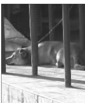
黄狗挡道

快报讯(记者 解璐)为了方便乘客候车,去年南京公交部门在13路公交车总站南湖站点设了一个候车区,乘车人按秩序上车,此举受到市民的广泛欢迎,但是昨天市民黄先生却给快报打来电话说,最近几天南湖站的候车区已经无人敢去了,候车又恢复了以往的一团糟。“一条大黄狗天天趴在候车区,够吓人的!”