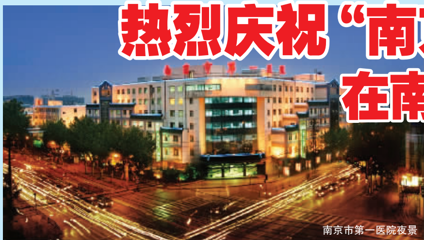
南京市第一医院夜景