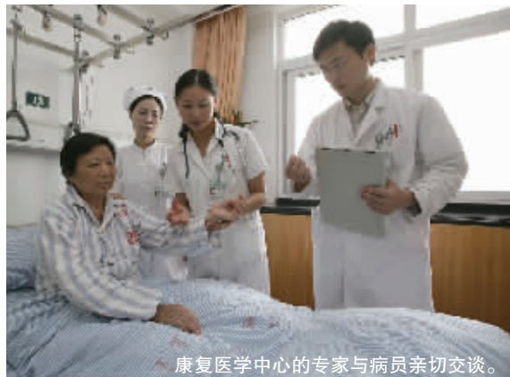
康复医学中心的专家与病员亲切交谈。

能紊乱、附件炎及炎性包块等疾病有着丰富的康复治疗经验;开展了颅脑外伤、脊髓损伤、手外伤、灼伤、截肢、持续植物状态等常见工伤病种患者的康复评定与治疗,临床疗效显著。咨询电话:025-52887050(护士站)、025-52887052(医生办公室)