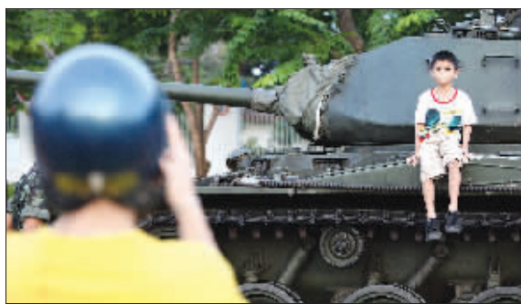
21日,曼谷一名小男孩坐在坦克上留影

此前,泰国军事政变领导人颂提将军表示,他信可以返回泰国国内,但必须接受审判,因为他受到腐败的指控。有学者说,现在对他信未来的去向作出判断还言之过早,曼谷朱拉隆功大学政治学家提迪南·蓬素提拉说,他信个性坚强,如果将来泰国在联合国的监督下举行选举,他信和他的泰爱泰党,还是很有可能再一次当选。目前还不能确定他信已“出局”,他不是个“愿意服输的人”,而且他的支持根基深厚。