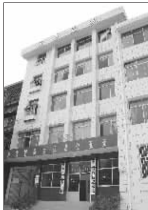
鹤峰党校外景(8月31日摄)